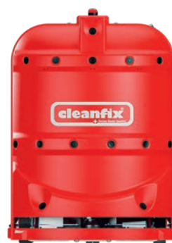
RA660 Navi XL