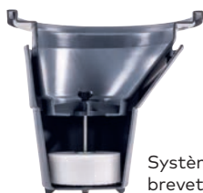
Système de flotteur breveté