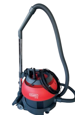
S10 Plus SL

RS05 CAS Système de batterie CAS : un seul type de batterie pour 300 différents machines (par ex. Metabo) Travail sans câble, jusqu'à une heure d'autonomie