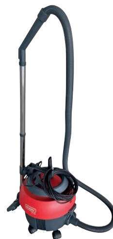
S10 Plus Bientôt également avec système de batterie CAS