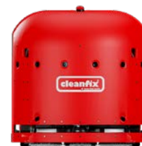
RA660 Navi M