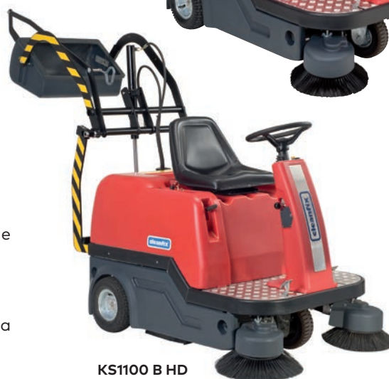
KS1100 B HD