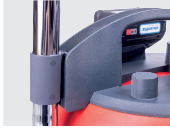
Support pour le tube d'aspiration