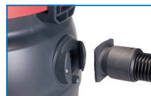
Branchement robuste et pratique