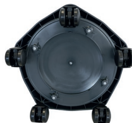
5 roulettes permettant un bon déplacement