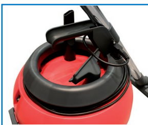
Poignée de transport et décharge de traction du câble