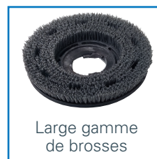
Large gamme de brosses