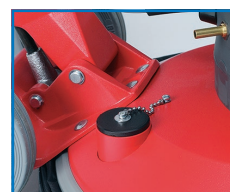
Prise pour unité d'aspiration