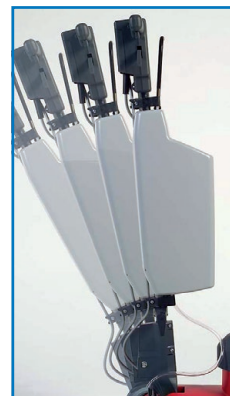
Réglage progressif de la poignée, en option avec réservoir à lessive