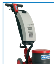
Montage facile de l'unité d'aspiration (option)