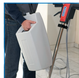
Montage et démontage simple du réservoir à lessive (option)