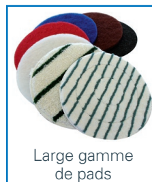
Large gamme de pads