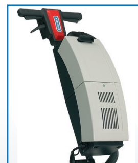
AS 05, aspirateur (option)