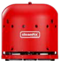
RA660 Navi M