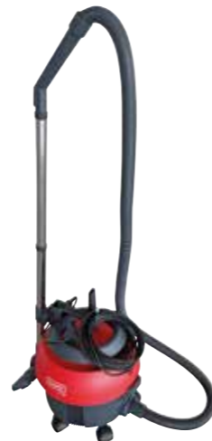
S10 plus Demnächst auch mit CAS Akku-System