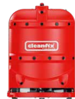
RA660 Navi XL