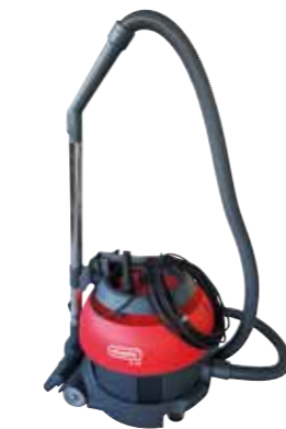
S10 plus SL