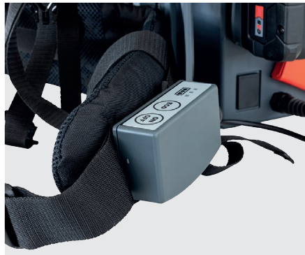
Bedieneinheit am Tragegurt