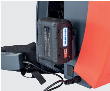
Akkuaufnahme seitlich des Saugers