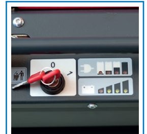
Batterie- und Onboard Ladegerät Anzeige inkl. Tiefentladeschutz