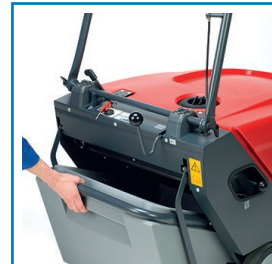
Einfaches Herausziehen des Schmutzbehälters