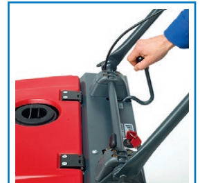
Hebel Seitenbesen absenken / anheben